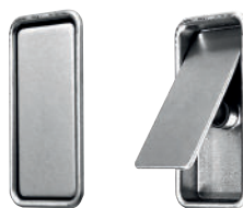
VÝKLOPNÁ ÚCHYTKA 30x60 mm